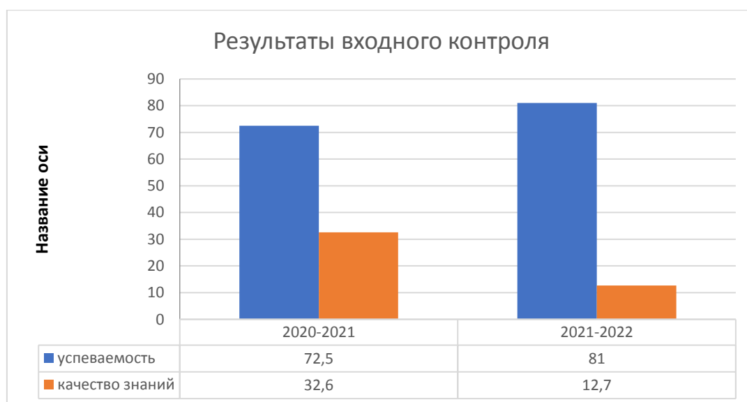
Диаграмма № 1

Анализ результатов входного контроля показал, что результаты успеваемости в 2021 году увеличилась на 8,5 %, а качество знаний уменьшилось на 19,9 % соответственно.