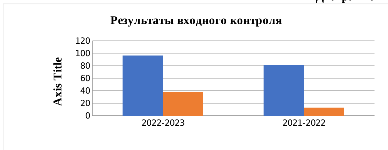
Диаграмма № 1

Анализ результатов входного контроля показал, что результаты успеваемости в 2022 году увеличилась на 15%, а качество знаний увеличилось на 25,3 % соответственно.